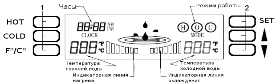
1,2 - Клавиши управления дисплеем